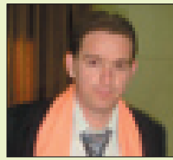
داروين فريق شمعون