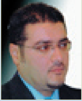
باسم عبد الاحد

يوم السابع والعشرين من شهر ايار عام ٢٠٠٩، يوم سنتذكره الرياضة العراقية والرياضيين العراقيين ولكن بألم وبغصة كبيرة.. انه يوم رحيل شاعر الكرة العراقية وشيخ المدربين الكابتن عمو بابا، بعد صراع طويل مع المرض استمر لأكثر من عشر سنوات.