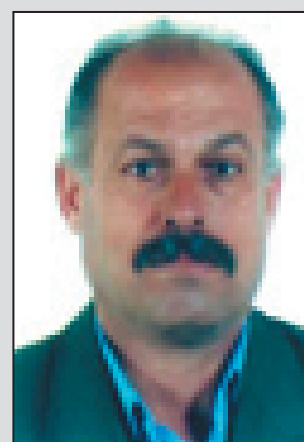
م/ عه دنان نیلیا