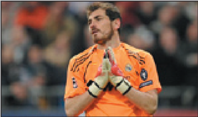
* كاسياس نادم بعد ثورته ضد باريوخو

قدم ليكر كاسياس حارس مرمى ريال مدريد اعتذاراً لدانييل باريوخو بعدما دخل معه في مشادة. وقال إن لاعب وسط خيتافي لم يرتكب أي خطأ عندما راوغ حارس منتخب إسبانيا قبل أن يسدد في الشباك الخالية. وحدثت هذه الواقعة خلال اللقاء الذي انتهى بفوز ريال مدريد ٤-٢ على خيتافي في دوري الدرجة الأولى الإسباني لكرة القدم عندما خرج كاسياس من منطقة الجزاء في محاولة لإبعاد الكرة، لكن باريوخو اقتنصها ليسجل أحد هدفي فريقه. وانتزع باريوخو الكرة بدون ارتكاب خطأ بينما سقط كاسياس أرضاً، وبعد أن تبادل الكرة مع زميله بيدرو ليون سدد اللاعب في شباك ريال مدريد من بين عدد من المدافعين. وعندما ذهب باريوخو للاطمئنان على كاسياس، رفض الحارس الدولي بغضب مصافحة لاعب خيتافي. وقال مانويل بلوغريني مدرب ريال في مؤتمر صحفي بعد اللقاء أن باريوخو هو لاعب سابق في ريال مدريد "خائن" لعدم إخراجه الكرة من الملعب، لكن كاسياس الأكثر هدوءاً الآن قال خلال مناسبة ترويجية أن باريوخو لم يرتكب أي خطأ.